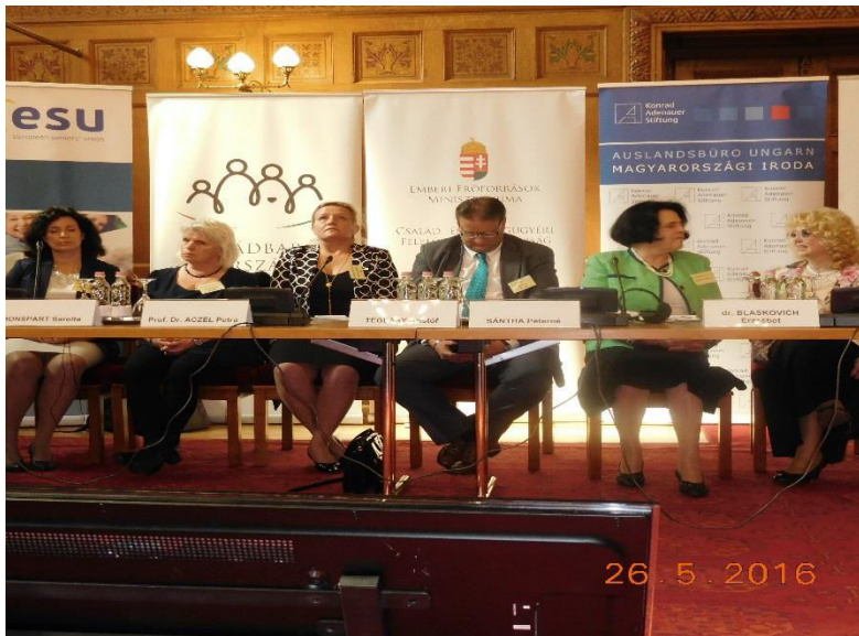
Einige Redner des 1. Konferenztages