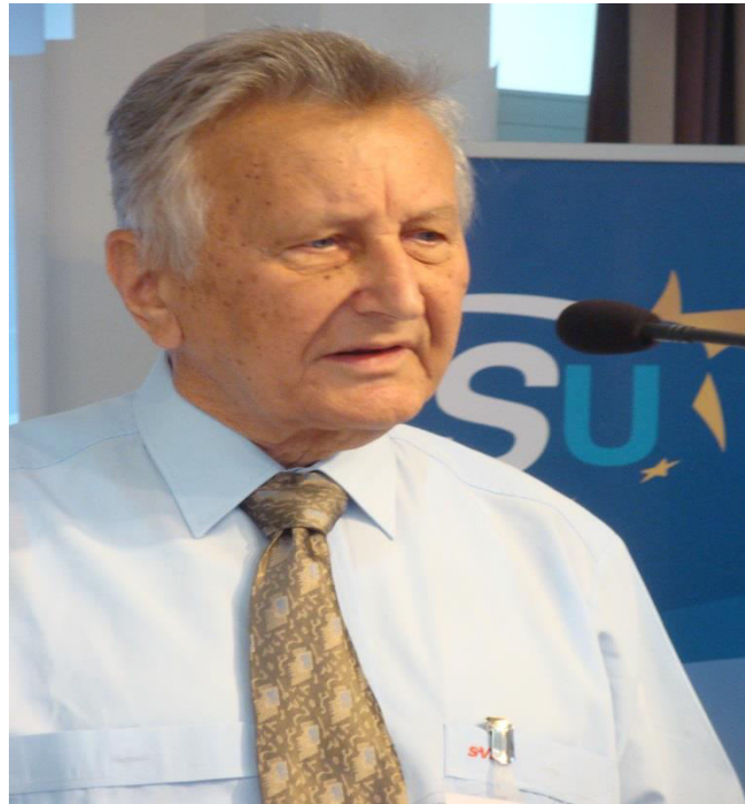
Der Jubilar an seinem 88. Geburtstag in Wien (2014)

Im Verlaufe der Wiener Sommerakademie nimmt der im In- und Ausland geschätzte Politiker